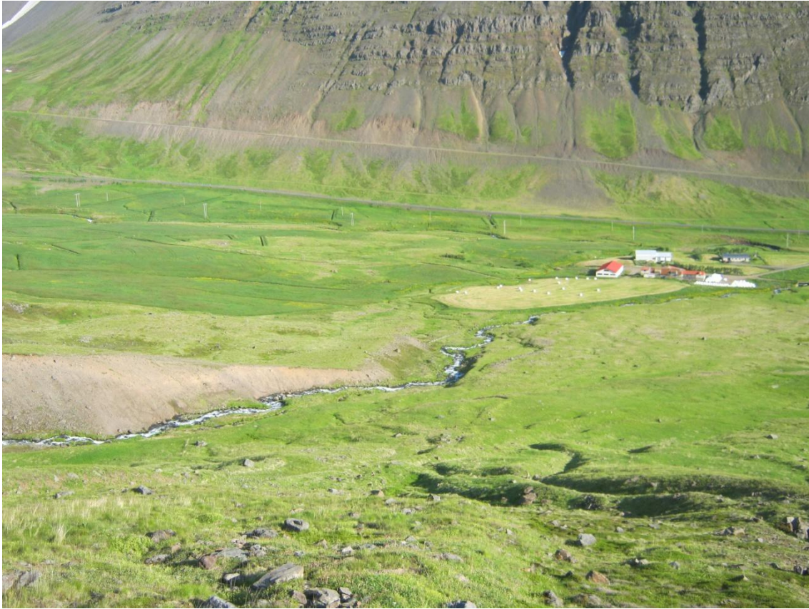
Mynd 20. Horft niður með Þveránni að Fremri Breiðadal.