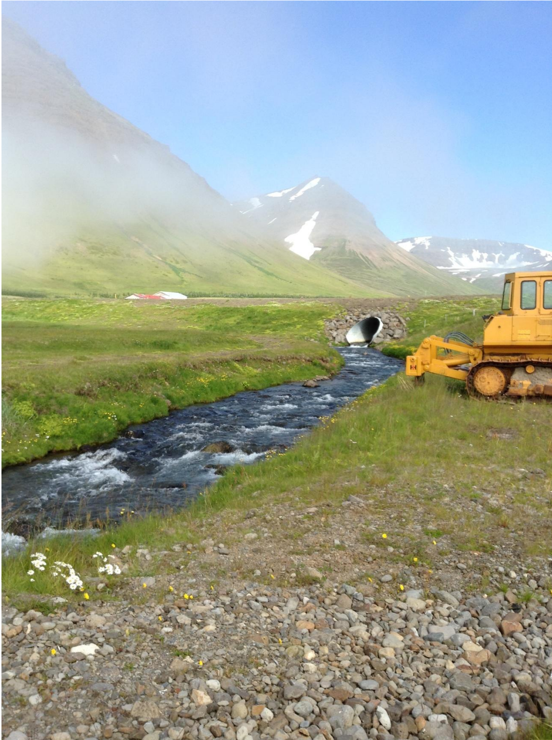
Mynd 22. Breiðadalsá við Varmadal. Ræsi í gegnum Flateyjarveg.