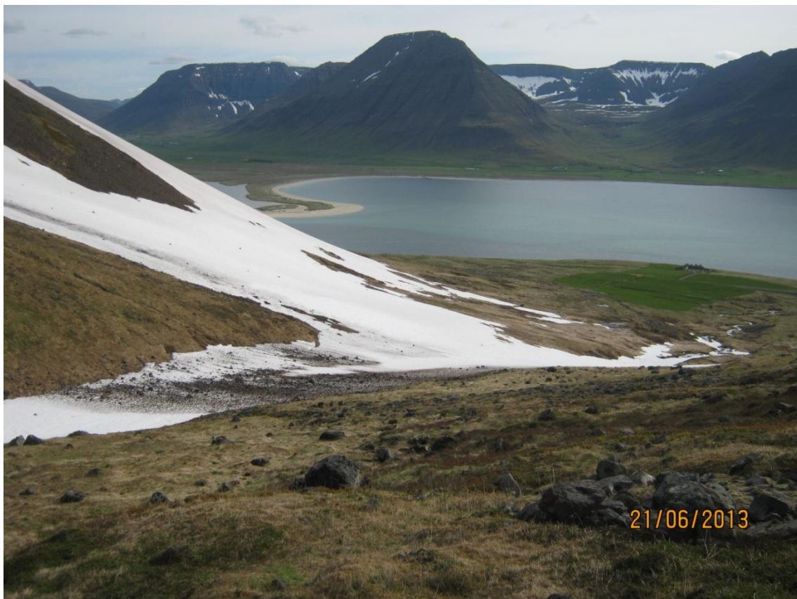
Mynd 11. Horft niður eftir Kaldárdal.