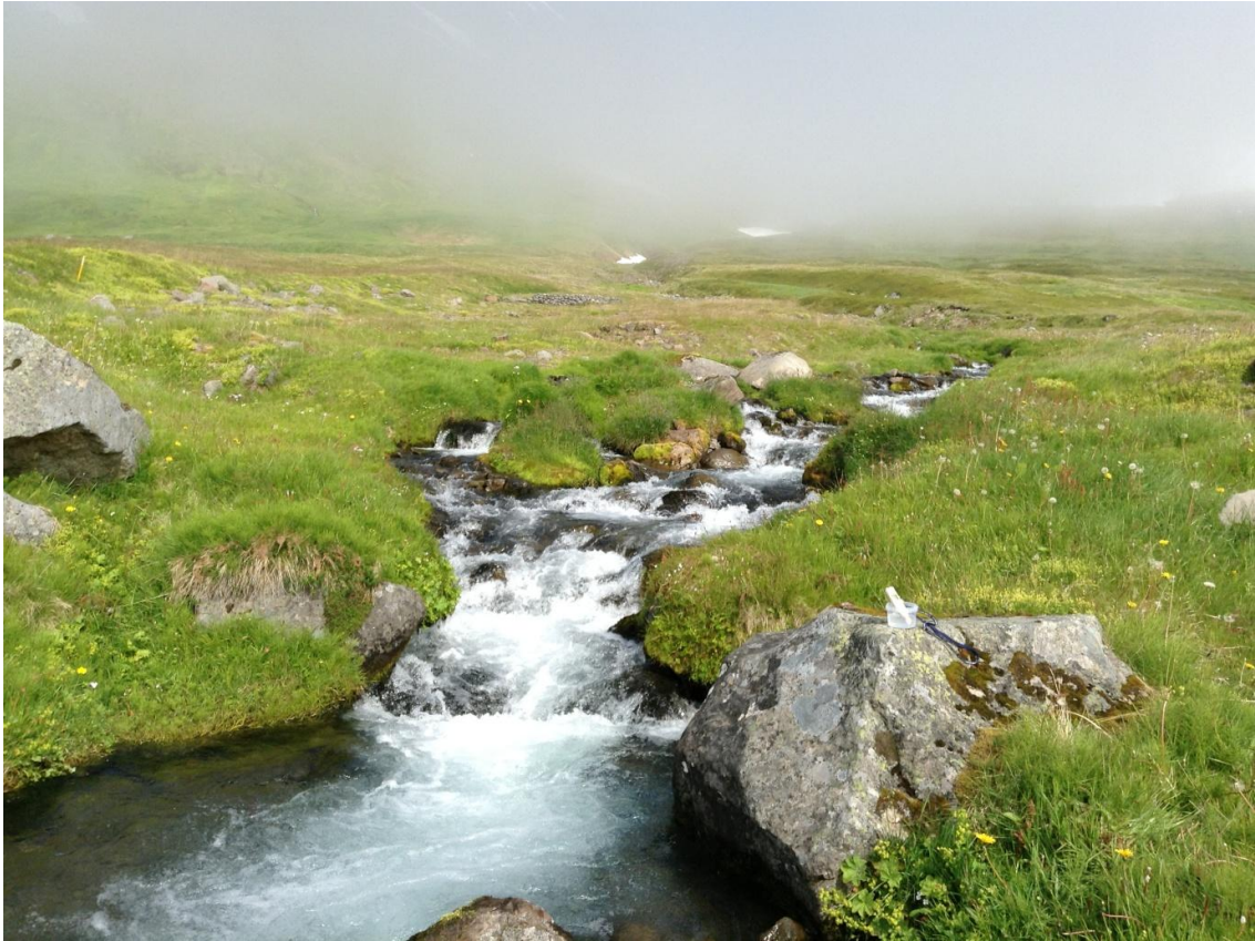
Mynd 5. Horft upp með Hólsánni.