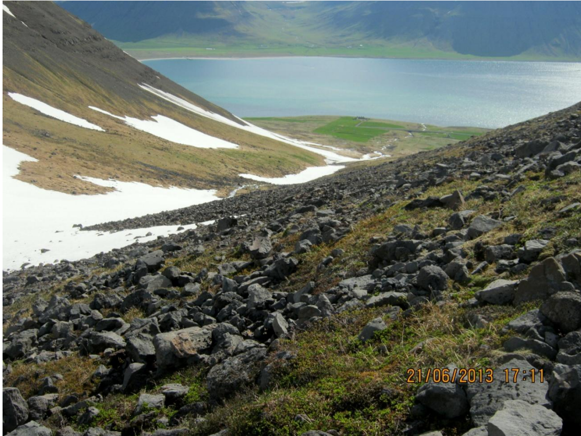
Mynd 8. Horft niður Kaldárdalinn.