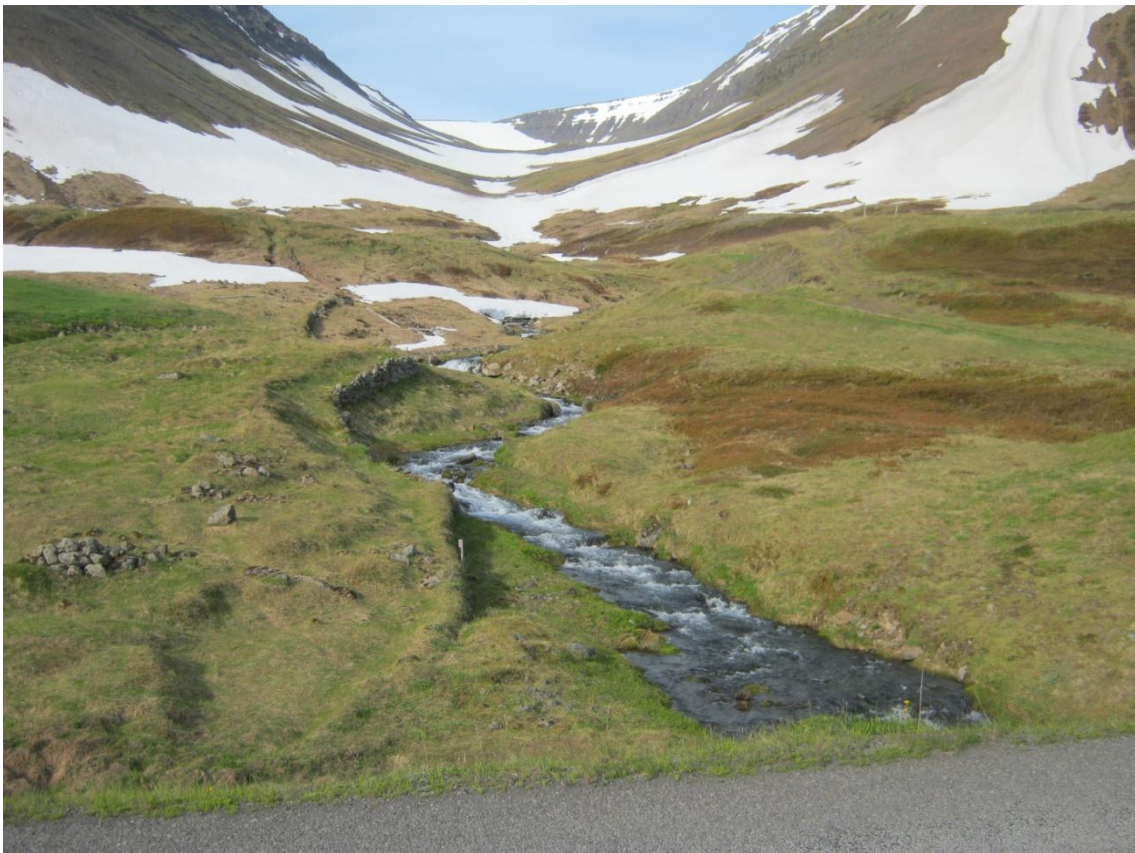
Mynd 13. Mynd tekin frá veginum og horft upp með Kaldánni.