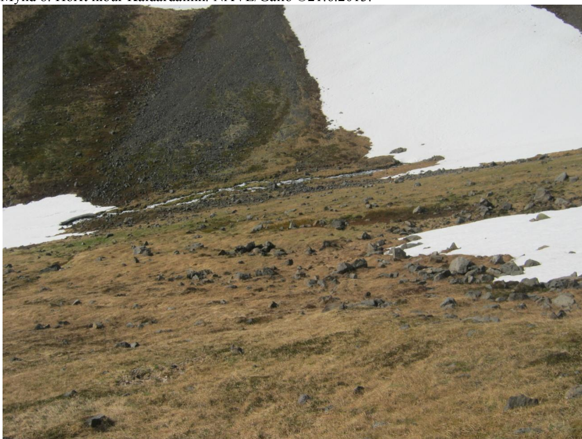
Mynd 9. Horft í vestur.