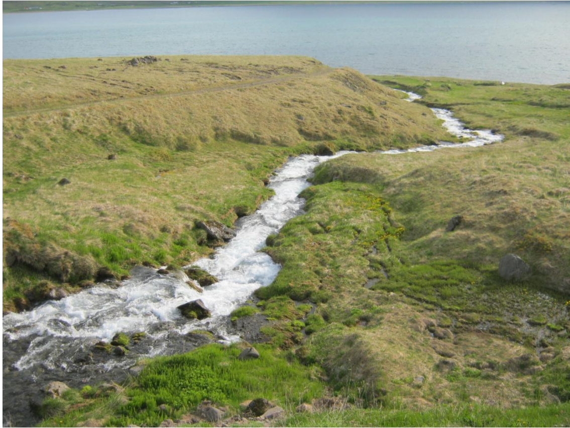
Mynd 14. Horft af veginum niður eftir ánni.