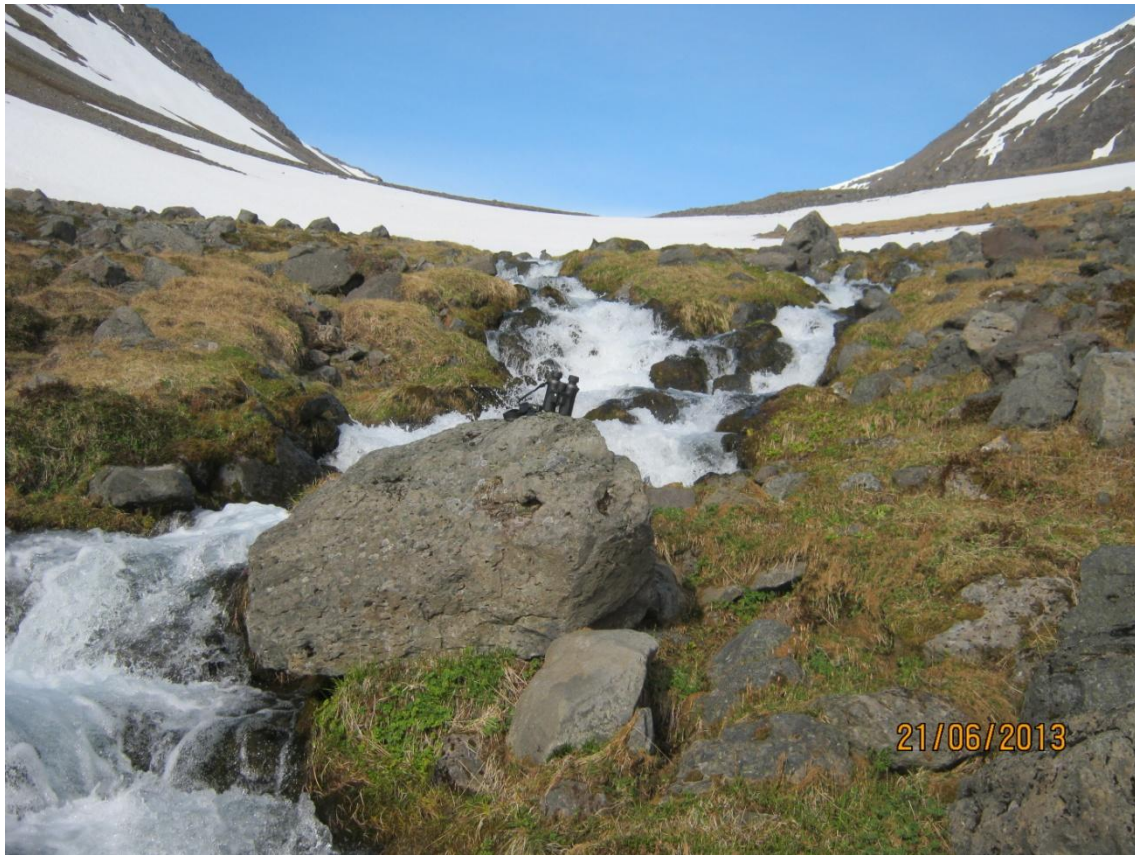
Mynd 10. Horft upp eftir Kaldánni.