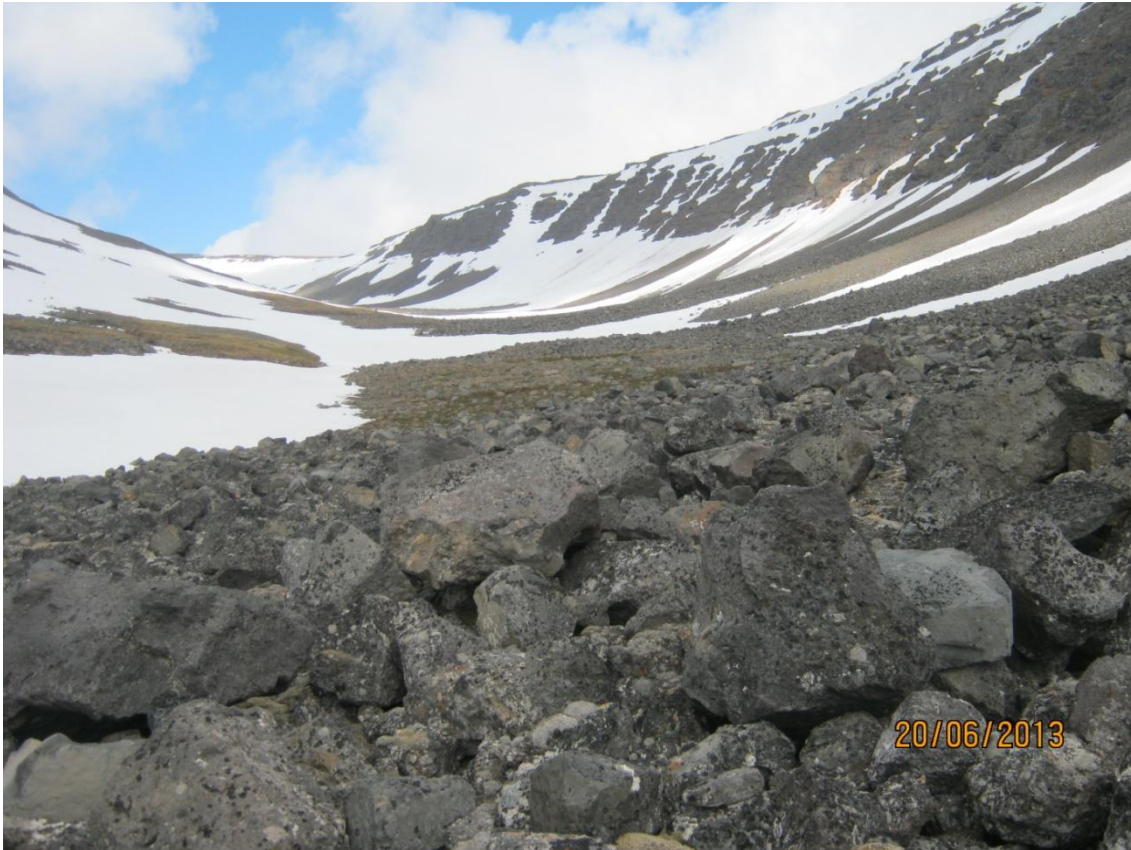
Mynd 2. Horft upp Hólsdal.

Myndir 2 og 3 sýna aðstæður upp í Hólsdal þann 28. júní 2013 en nokkur snjór var á þeim tíma. Tekin er ein mynd niður eftir úr mynni dalsins í júní og sést vel hvað svæðið er blautt utan við Hólsá. Myndir 5 og 6 eru teknar í júlí og þar má sjá að árbakkarnir neðarlega í ánni eru vel grónir. Einnig má sjá á mynd 5 steyp tæsi sem liggur í gegnum Flateyrvæg.