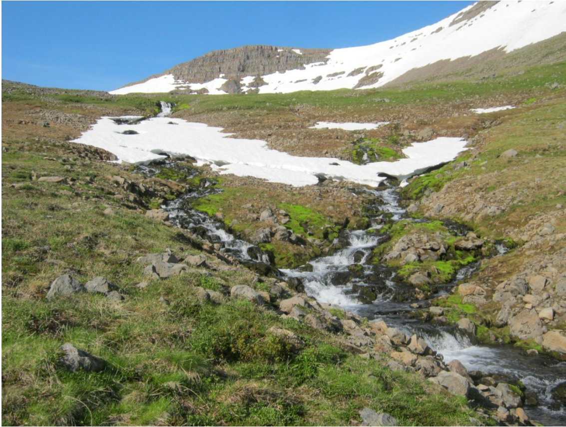
Mynd 16. Horft upp eftir ánni í Þverdal.