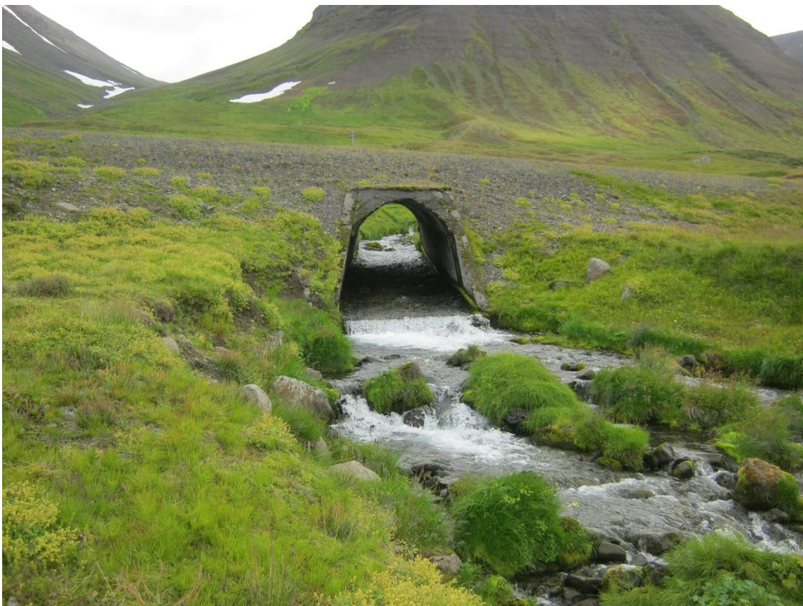
Mynd 6. Hólsá, mynd tekin fyrir neðan Flateyjarveg. Ræsið í gegnum Flateyjarveg er steypt ræsi með steyptum botni.