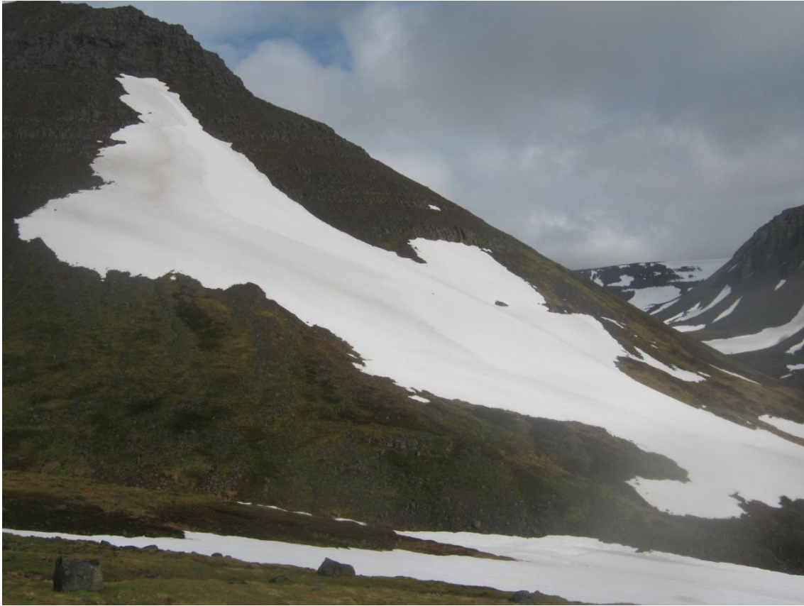
Mynd 18. Snjóflóð í austanverðum Þverdal, snjór yfir ánni.