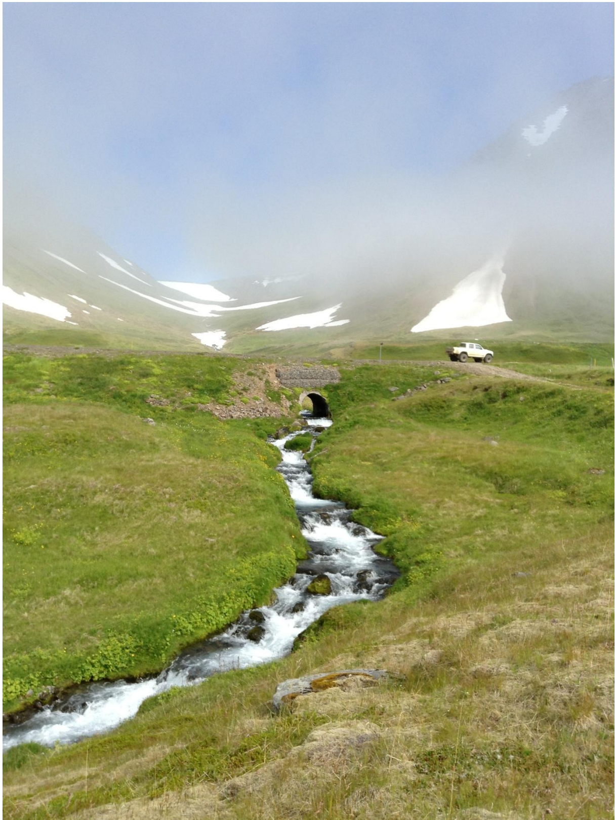
Mynd 15. Horft upp eftir ánni.