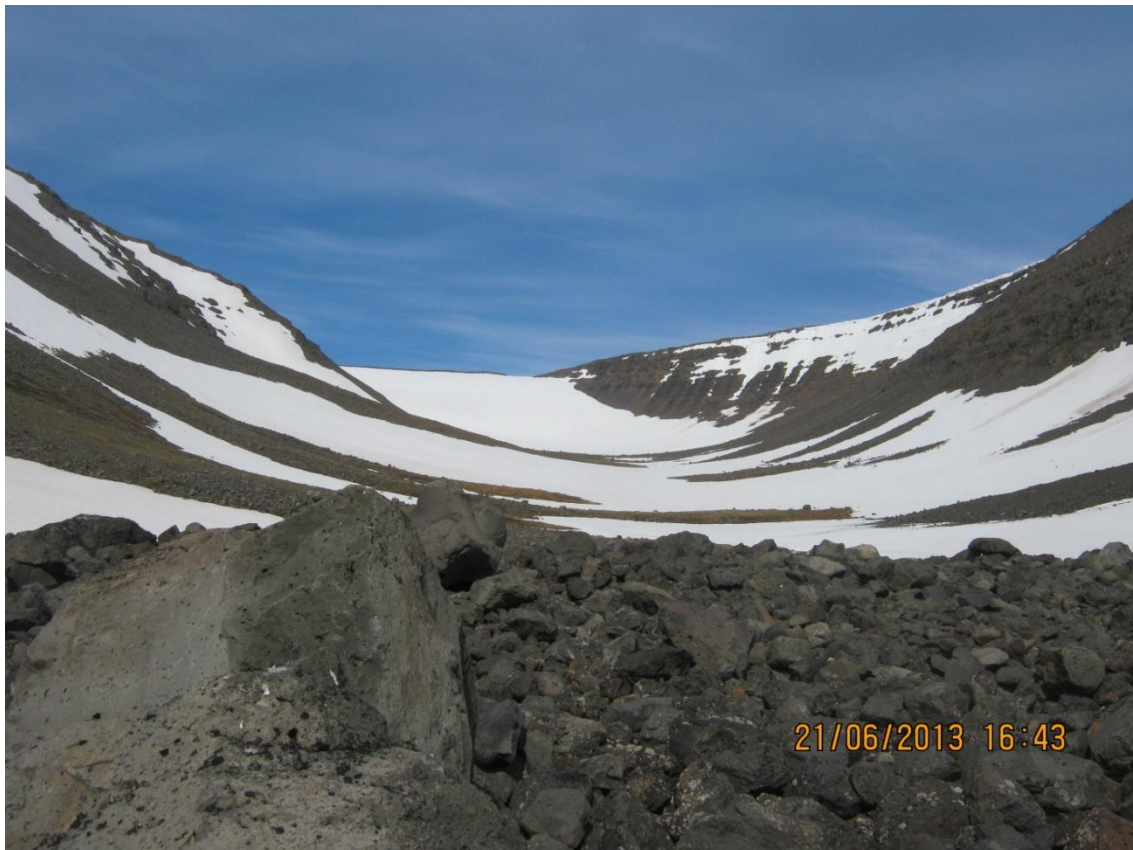
Mynd 7. Efst í Kaldárdal, horft upp.

Myndaröðin (7-15) byrjar efst í dalnum og færir niður að sjó.