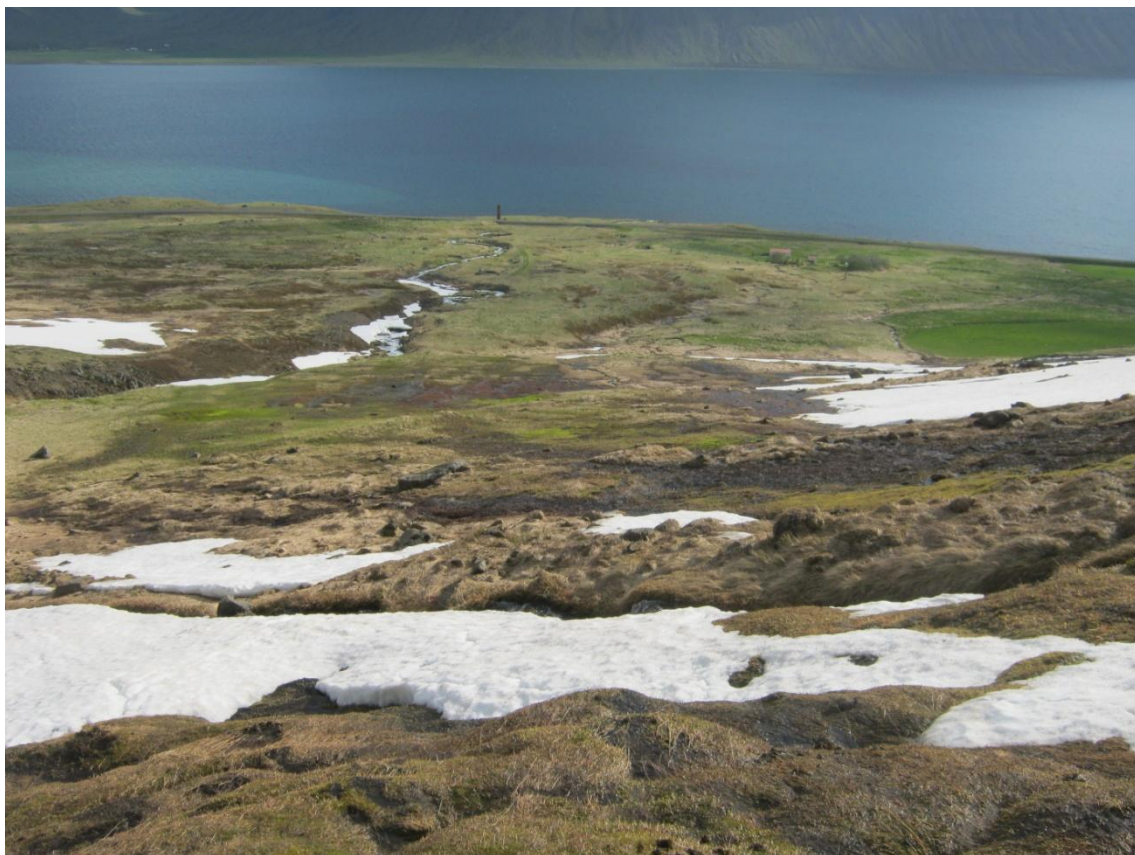
Mynd 4. Horft niður að Hólsánni.