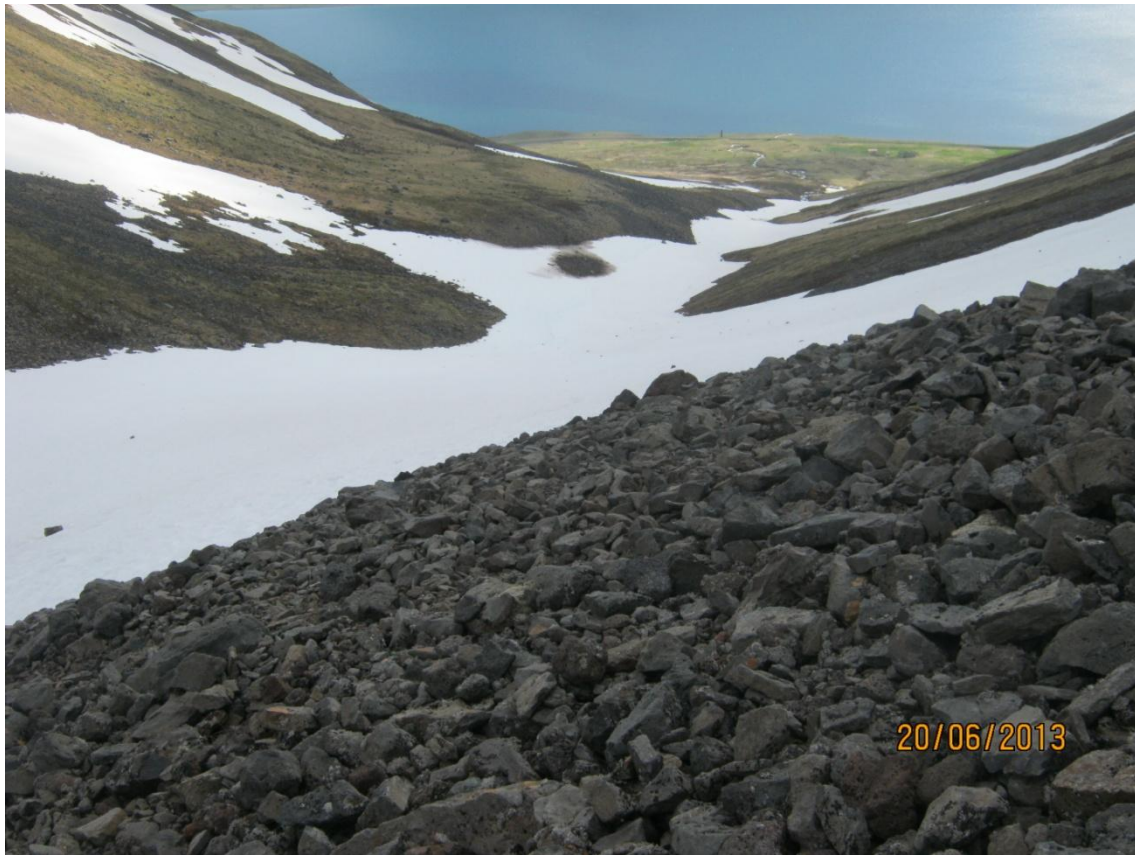
Mynd 3. Horft niður Hólsdal.