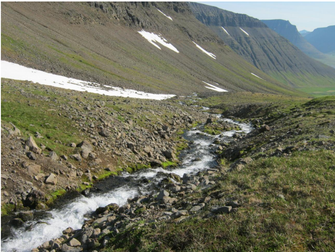
Mynd 17. Horft niður eftir með ánni.