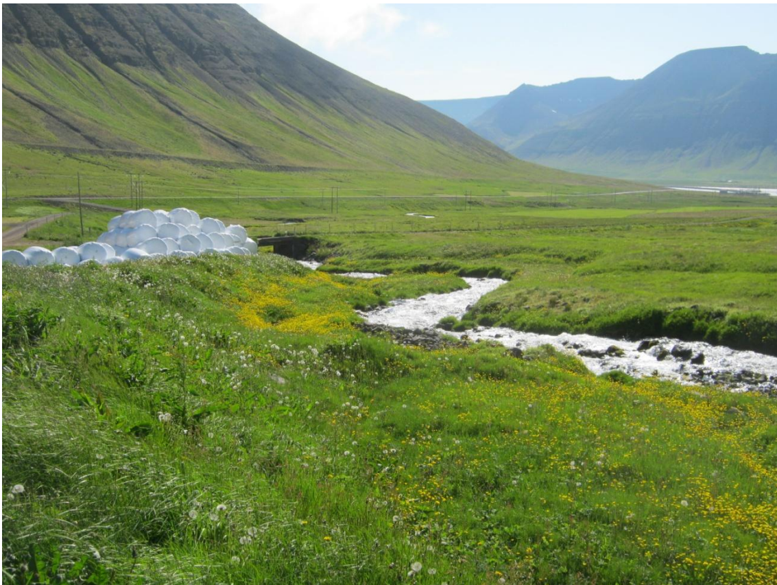
Mynd 21. Þverá. Horft niður að ármótum Þverár og Langár.