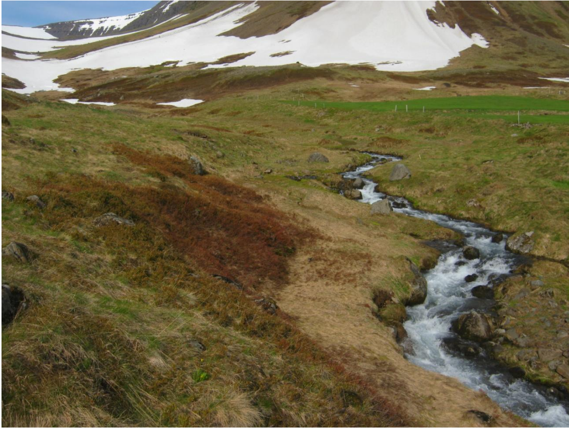
Mynd 12. Horft upp með Kaldánni.