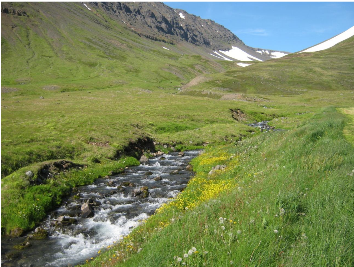
Mynd 19. Þverá, Mynd tekin aðeins fyrir ofan bæinn Fremri Breiðadal.